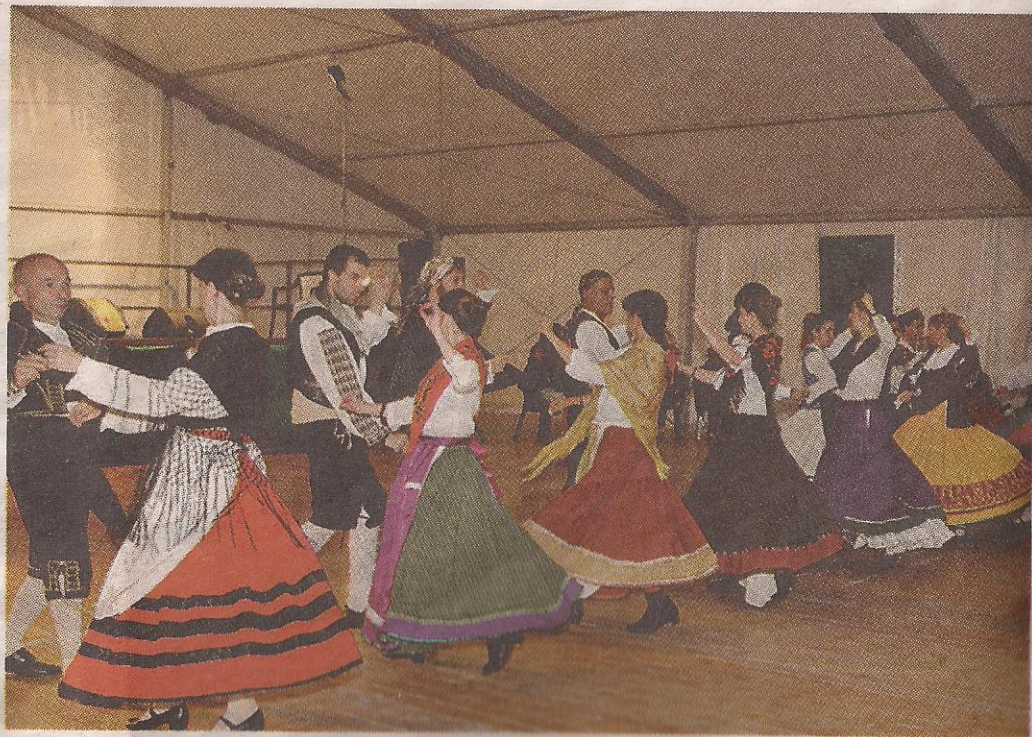
Un momento del Gran Bal Trad. Sul sito www.lasentinella.it le foto della manifestazione

disfatti soprattutto per il miglioramento della qualità e del livello degli artisti, compresi quelli delle regioni italiane invitati per celebrare i 150 anni dell'Unità d'Italia - e intendiamo ringraziare tutti: artisti, ospiti, volontari e soprattutto, per il grande supporto che ci assicurano da sette anni, il Comune e la Pro loco».