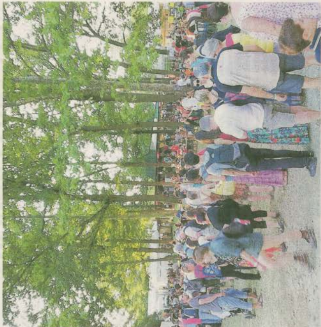
In un anno le presenze sono salite da 10 a 12mila, l'incremento di pubblico è del 20%