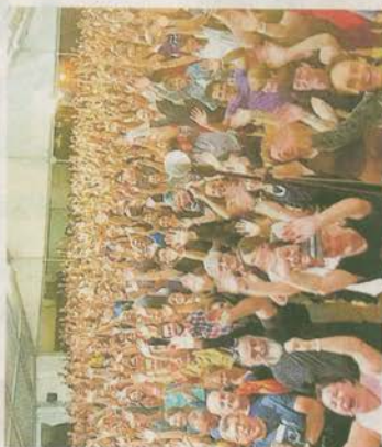
Un momento dell'edizione 2018

Le iscrizioni on line resteranno aperte fino al 10 giugno, con sconti che arrivano fino al trenta per cento sulla quota di partecipazione: «Il Festival in questo 2019 - è anticipato in un comunicato delle associazioni organizzatrici - durerà un giorno in più, per far fronte alle tante richieste pervenute al proposito da tutta Europa. Si inizierà infatti a ballare