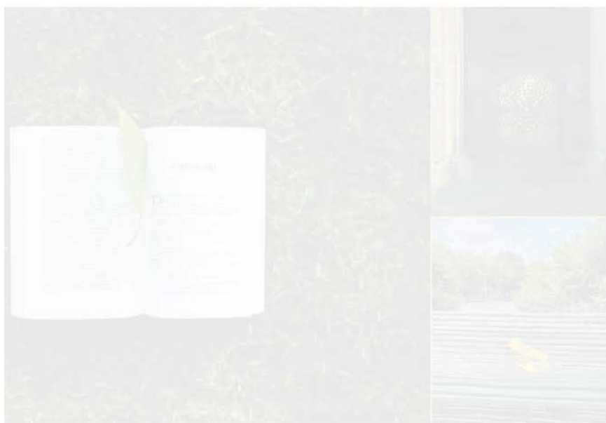
Solo per fare qualche esempio: al Valentino, davanti all'ingresso del Mao, sulle panchine del Fante, di fronte al Politecnico