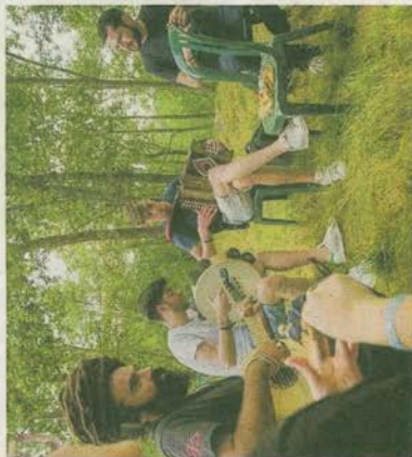
Alcuni musicisti a Vialfrè in una foto di archivio

I partecipanti devono inviare entro il 12 giugno una foto scattata nelle precedenti edizioni del Festival con l'hashtag #prostaevinci. La foto che riceverà il numero maggiore di like e condivisioni vincerà i passi gratis: pranzo e cena, per tutta la durata del Gbt. A proposito di sicurezza, a seguito di una delibera commu-